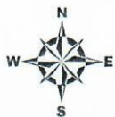
СХЕМА ГРАНИЦ РЫБОВОДНОГО УЧАСТКА