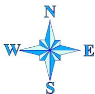
СХЕМА ВОДНОГО ОБЪЕКТА