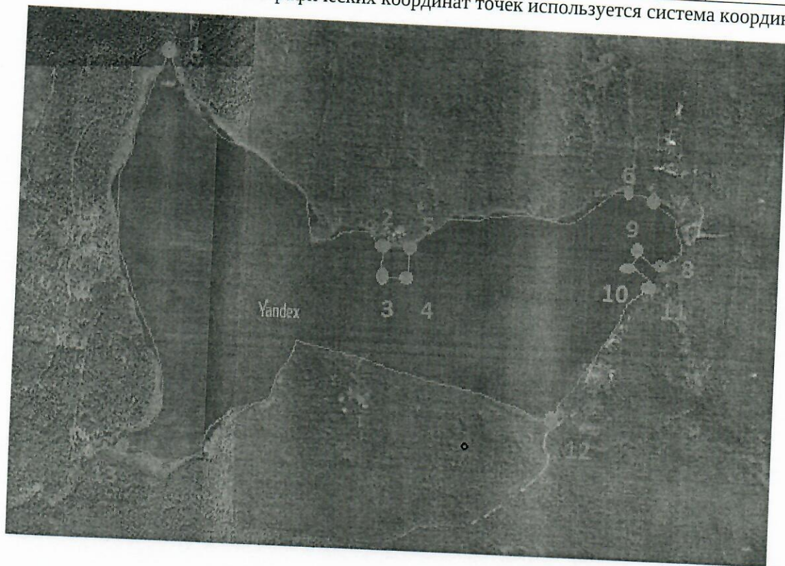
— граница рыбоводного участка

* здесь и далее для обозначения географических координат точек используется система координат ГСК 2011