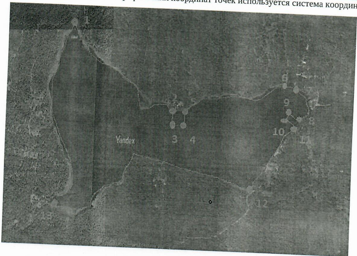
— - граница рыбоводного участка

* здесь и далее для обозначения географических координат точек используется система координат ГСК 2011